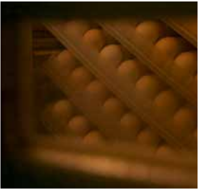
eieren in één van de drie incubatoren in de Usine te Bobo-Dioulasso