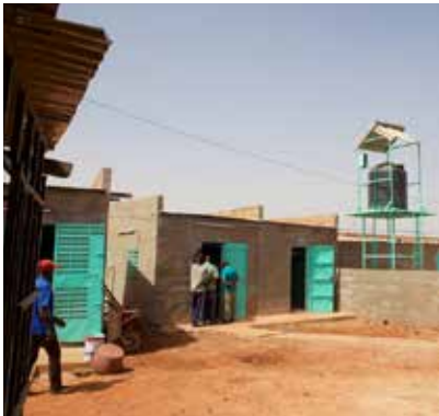
De Usine te Bobo Dioulasso, Burkina Faso

Er werd een 'ei' gelegd bij stelling 9/ 9,5 van het PSC Manifest (zie ook pag. 7).