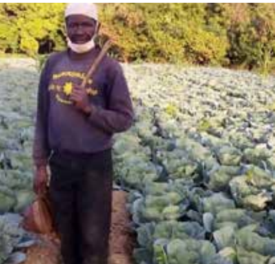
naast ajuin is er ook kool. Loslopende ezels hebben deze ook al ontdekt ...