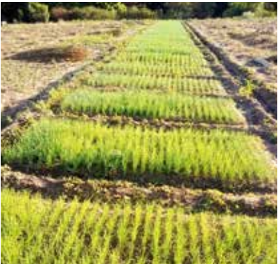
de bron van Kimidougou heeft de teelt van ajuin mogelijk gemaakt