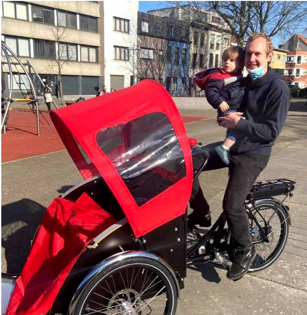
ook nieuw bij Open-Huis : de riksja voor bijzondere tochtjes

Die zijn nu met elkaar in contact gebracht en de Dienst Gezondheid vindt dat dit aanbod ook na corona moet doorgaan. Open Huis, klein maar dapper, werpt zich hiervoor op om dit structureel te verankeren. En, belangrijk: Open Huis is de enige organisatie waar de telefoongesprekken gebeuren door mensen uit de doelgroep, mensen dus