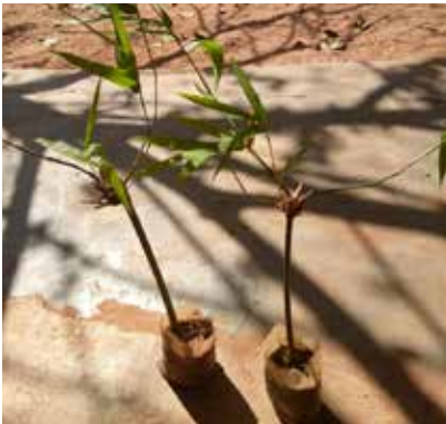
jonge bamboe, wanneer volgroeid geschikt om kip-penstallen van te bouwen