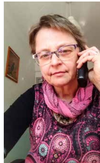
Basis: de telefoon pakken voor een telefoongesprek

Wat is er veel weefsel verzwakt in de stad: geen evenementen, debatten, trefdagen en bijeenkomsten meer. We zijn op onze bubbels teruggeworpen.