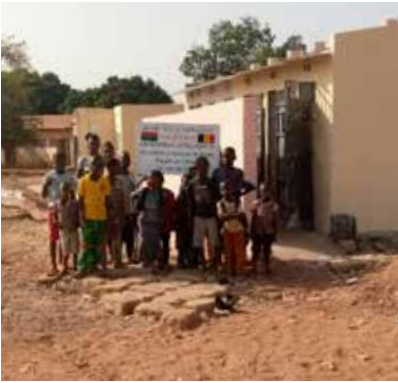
vernieuwde toiletten voor een school van 1500 kinderen

zich ernstig zorgen. Kon je kinderen nog wel naar school laten gaan als er geen toiletten beschikbaar waren. De hulp die geboden kon worden om het materiaal te kopen, deed de ouders weer geloven dat met samenwerking over grenzen heen, problemen niet het laatste woord hebben.