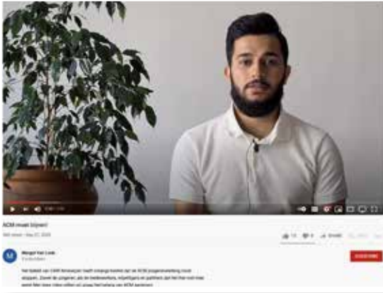
Jongeren vragen aandacht voor de crisis waarin de werking verkeert - YouTube (2020) -

onze partners (anciens en nieuwe) hebben hun beeld van geëngageerd netwerk alle eer aan gedaan. De voorbije maanden zijn een toonbeeld van hoe bottom-up handelen kan werken. Vanuit een oprechte bezorgdheid voor de doelgroep en het mogelijke verlies van methodiek is er dan toch voor gekozen de Jongerenwerking voort te laten bestaan. Waar dit voorheen binnen het kader van het CAW werd gerealiseerd, heeft een oude bekende zich in het verhaal gesmeten: PSC vzw zet zijn schouders mee onder dit project. Vanuit het CAW zullen we werken aan een verbindend scenario qua individuele begeleiding van de jongeren.