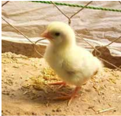
jong kuiken waarvan de opbrengst als basis dient voor nieuwe op te starten projecten