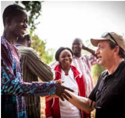
een handdruk als blijk van vertrouwen in elkaars talenten

De uitwerking laat duidelijk zien dat deze inzet het verschil maakt voor de medewerkers zelf maar ook voor hun familie en mensen in hun omgeving.